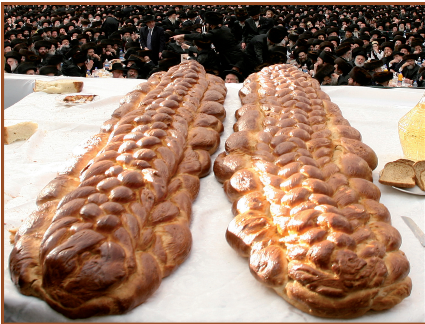
להקריב שתי הלחם לה' – "לחם מן השמים" עם "לחם מן הארץ"

דלתתא יתעורר עובדא דלעילא. וכן הוא בזוהר הקדוש (פרשת וארא לא:): "תא חזי באתערותא דלתתא אתער לעילא, ועד לא יתער לתתא לא יתער לעילא".